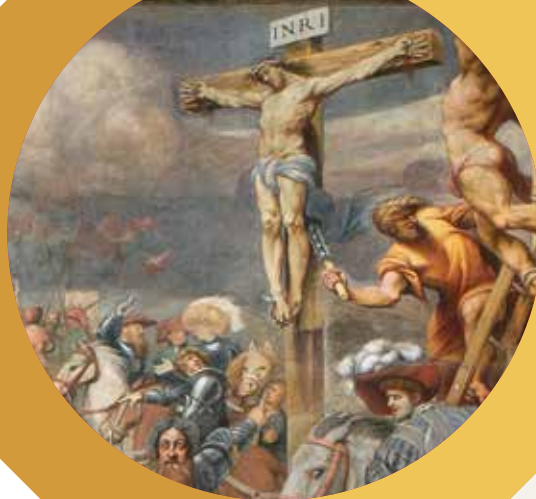
“Crocifissione”, (Antonio de Sacchis detto Il Pordenone, 1520-1521) Controfacciata, particolare